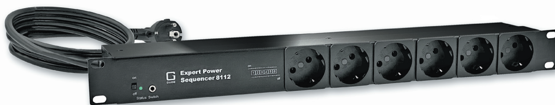
Expert Power Sequencer 8112-3 und 8112-4 mit 6 Schutzkontakt-Anschlüssen auf der Frontseite

Betreiber von Audio-Racks profitieren von der Schaltsequenz des Expert Power Sequencer 8112