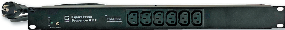
Expert Power Sequencer 8112-1 und 8112-2 mit 6 IEC C13-Anschlüssen auf der Frontseite

Der Expert Power Sequencer 8112 kommt beispielsweise in AV-Installationen mit einer Endstufe zum Einsatz. Der dort verwendete Audioverstärker wird am letzten Lastausgang angeschlossen. Die PDU sorgt nun dafür, dass der Verstärker nach den anderen Komponenten als letztes eingeschaltet wird. Beim Ausschalten in umgekehrter Reihenfolge wird er vor den anderen Komponenten als erstes geschaltet. Die andernfalls auftretenden Knallgeräusche, die nicht nur unangenehm sein können, sondern auch Lautsprecher und Verstärker schädigen können, gehören damit der Vergangenheit an.